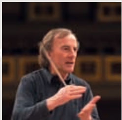
Lothar Zagrosek Dirigent